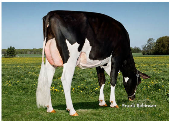
FERN-OAK LAUMAN 24249