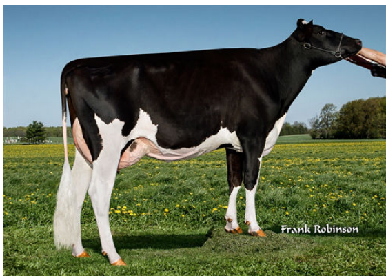
FERN-OAK LAUMAN 24249